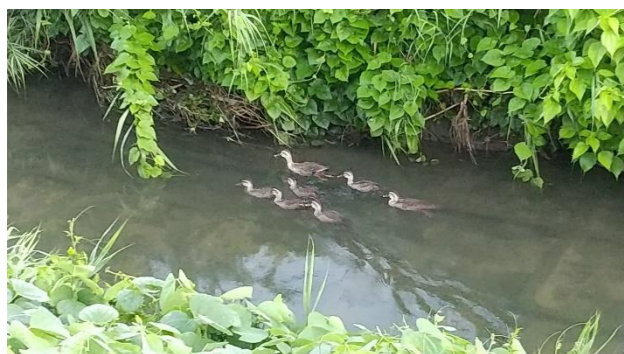
「竹田川の鴨の親子」 大野淳子