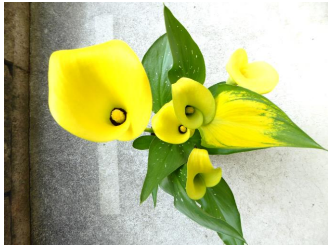
黄色いカラー