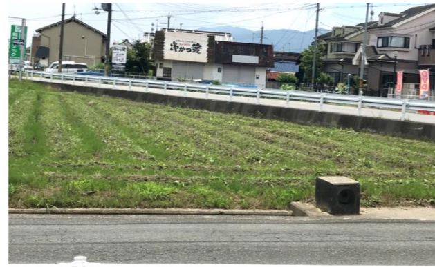
北今市写楽クラブ

自治会では北今市のもの・風景・建物・人物など、「北今市の宝物」の写真を募集しています。お持ちの方は下記のメールアドレスまでお送りください。尚、スペースに限りがあり掲載できない場合がございます。ご了承ください。北今市自治会総務広報：kitaimaichi@gmail.com